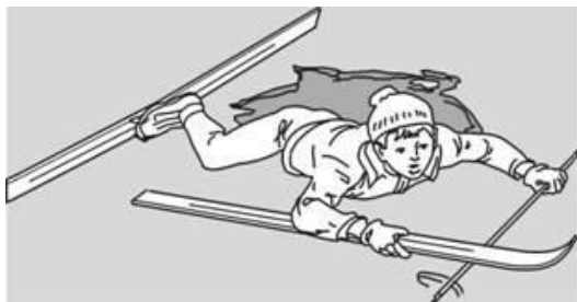
Попытки вылезти самому из полыньи с лыжами

Провалившемуся необходимо внушить, чтобы он широко раскинул руки на льду и ждал помощи, так как самостоятельная попытка вылезти из воды может привести к новому обламыванию кромки льда и очередному погружению пострадавшего под лед.