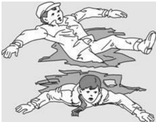
Попытки вылезти самому из полыньи грудью или спиной

Если вы провалились под лед, широко раскиньте руки, навалитесь грудью или спиной на лед и постарайтесь вылезти на него самостоятельно, зовите на помощь.